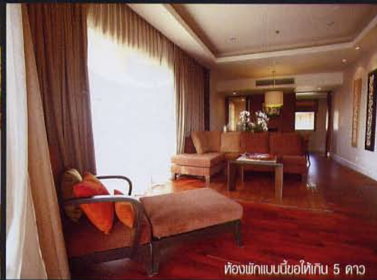
ห้องพักแบบน้อยใต้กัน 5 ดาว