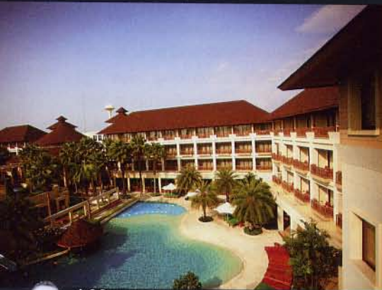
ทั้งโอโซน และ อสังหาร