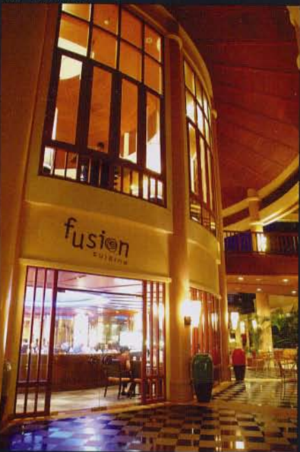
ภัตตาคาร Fusion ที่บางของอาหาร 5 ดาว