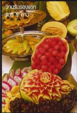
งานรับรองแขก แบบ 5 ดาว