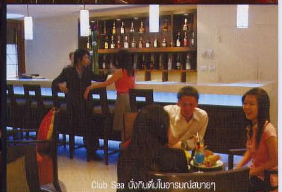
Club Sea นั่งกับคัมโปอานกนสบายๆ

เดินจากถนนเข้าสู่อาคารหลังเล่นระดับจากพื้นราบขึ้นไปสู่แนวชั้นสองของอาคารส่วนกลาง ซึ่งถูกจัดให้เป็นลิโอบบี้ และส่วนต้อนรับ โดยเพดานที่สูงโปร่งทำให้สัมผัสกับความผ่อนคลายตั้งแต่ได้ก้าวเข้ามา อีกจุดหนึ่งที่สวยงามเป็นจุดเด่นของเดอะโหดคือทางด้านห้องอาหารชั้นล่าง โดยห้องอาหารนี้แบ่งออกเป็นสองส่วน ส่วนแรกอยู่ในห้องกระจก ที่ได้จัดแต่งเฟอร์นิเจอร์อย่างหรู และอีกส่วนอยู่นอกห้องกระจก ติดกับสระน้ำ สำหรับผู้ชื่นชอบอากาศบริสุทธิ์