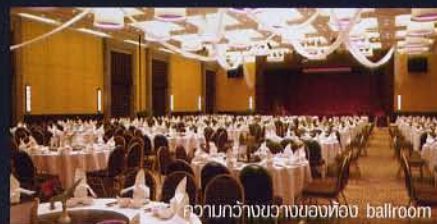
ความกว้างขวางของห้อง ballroom

มี 2 แพคเกจ ได้แก่ “Hello Holiday Package” ที่ให้ห้องพัก Deluxe สุดหรู 3 วัน 2 คืน สำหรับ 2 คน พร้อมดินเนอร์สุดหรู ที่ Fusion Cuisine หรือ