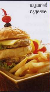
เมนูเบเกอร์ ทรูสคอต