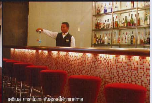
เดซิเบล คาราโอเกะ สังสรรค์ได้ทุกเทศกาล