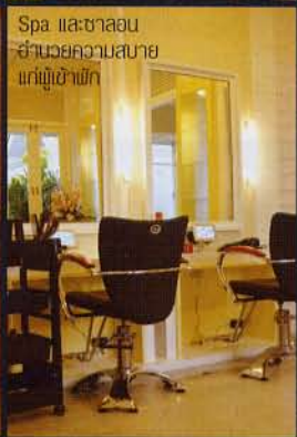
Spa และชาลอน อำนวยความสะดวก แก่ผู้เข้าพัก