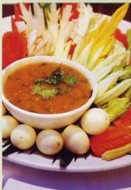
▲辣蟹子沙律 (HK$20)，單是賣相已十分吸引。