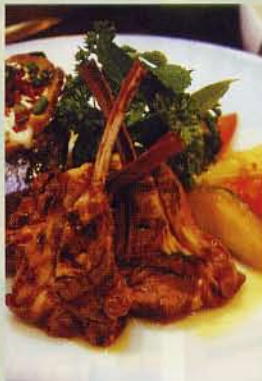
▲煎羊扒 (HK$80)，肥美多汁，又不怕癢。