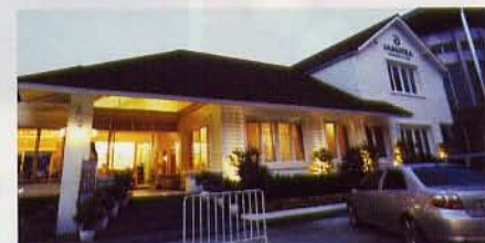
大白屋式設計，感覺像一間別墅多過Spa。