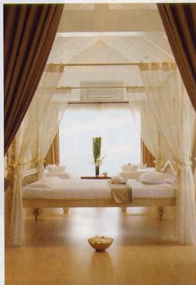
房間以簡潔的白色為主調，給人一種乾淨及和諧的感覺。

這是市內最具規模的Spa，位於The Tide Resort旁，分了兩層，有泰式按摩房、腳按房，更有Spa房，Spa房全設有浸浴缸，環境、感覺都不錯，甚有5星級格局，大白屋式設計，情調和氣氛都很好。