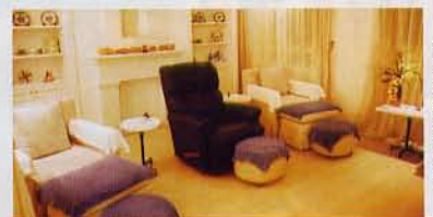
腳底按摩的房間，座椅及環境亦同樣舒適。