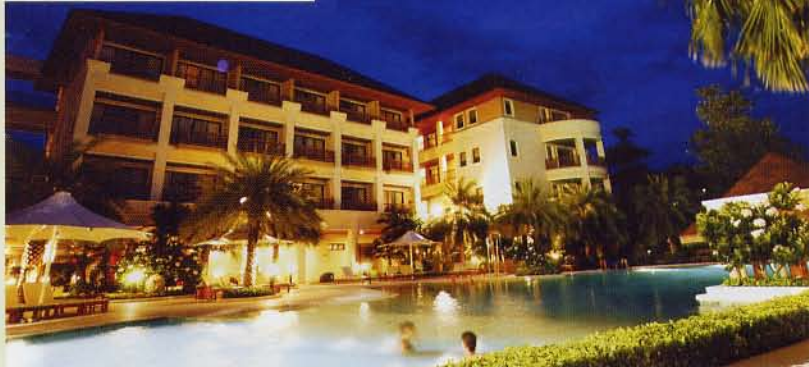
▲酒店及泳池晚上亮起燈光，加上椰樹襯托，具有另一番風情。