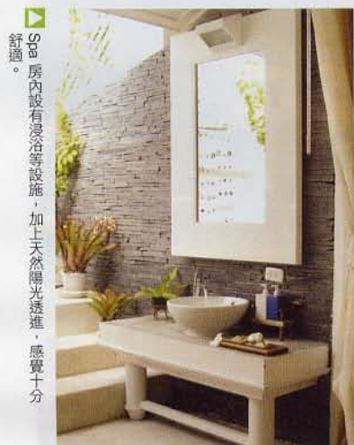
Spa房內設有浸浴等設施，加上天然陽光透進，感覺十分舒適。