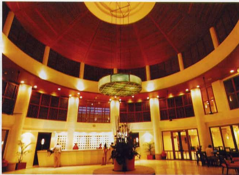
▲酒店大堂，氣派非凡。