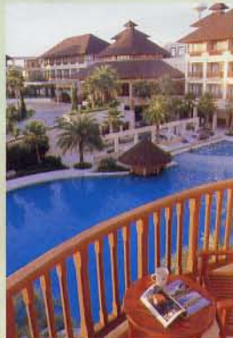
▲於酒店的露台，可看到外邊的池景，感覺優閒舒適。