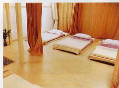
按摩房間亦以淺色作為主調，加上淺木作配襯，亦同樣簡潔。