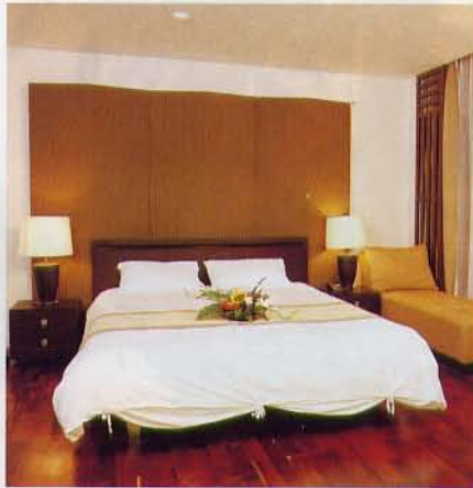
▲房間無論是環境及質素都甚有五星級的氣派。

從Resort走5分鐘直出便是海灘。詳情可瀏覽其網址 http://www.thetide-resort.com/ 。